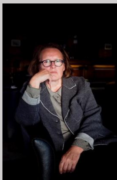
Christine Frisinghelli Fundación Camera Austria